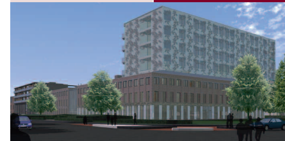
dok Zuid gezien vanaf de Marchantstraat (artist impression)