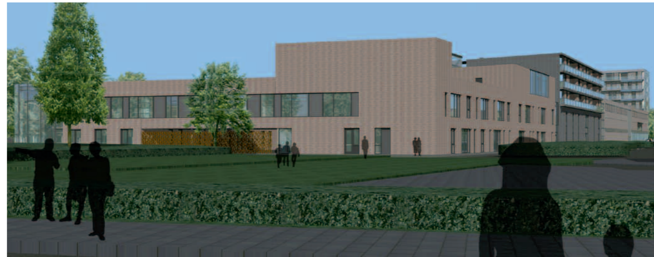
een kijk op de zuid-ingang van de Brede Vleugelschool (artist impression)